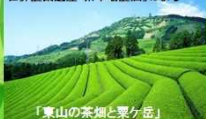
「東山の茶畑と粟ヶ岳」