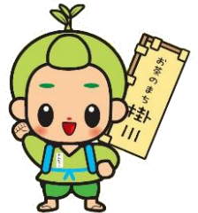
茶のみやきんじろうくん