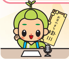
茶のみやきんじろう