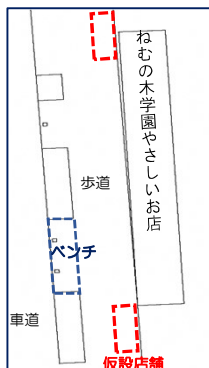
ねむの木学園前 会場