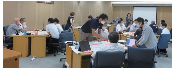
研修会のワークショップの様子