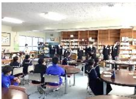
城東中 eじゃん掛川

1月12日から27日までの期間で市内9中学校を訪問し、延べ約200人の中学生と意見交換会（ヒアリング）をおこないました。また、ウェブフォームに700件を超える投稿（とうこう）をいただき、新制服のスタイルやジャケットの色などについて御意見をいただきました。