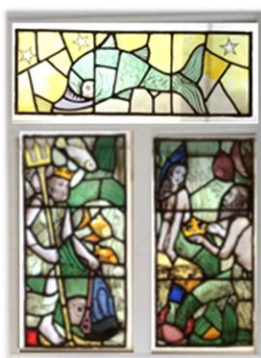
※玄関に設置される予定の