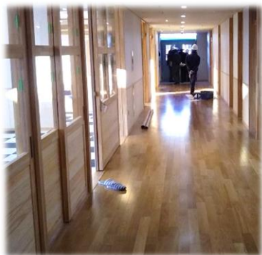
※木をたくさん使った廊下