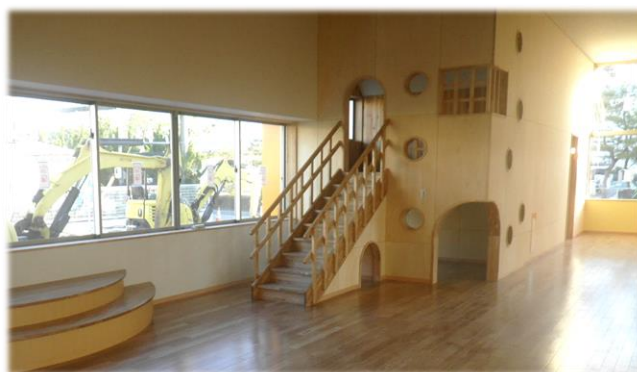
※半円形のコーナー(左)と隠れ家「でん」(右)