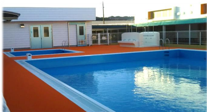
※固定プール（写真手前が4、5歳児用、奥が3歳児用）

現在は平成31年1月末の新園舎、園庭の工事完了に向けて、備品の整備なども進めています。2月15日午前に新園舎完成式典、午後に内覧会を行い、4月に開園する予定です。