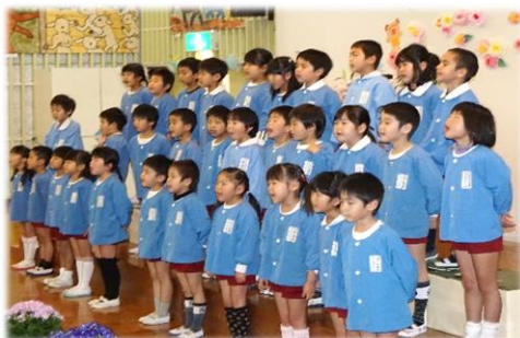
園児による歌の披露