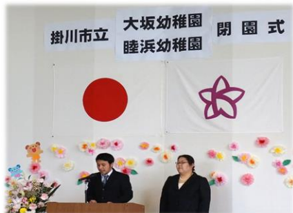
両園PTA会長のあいさつ

3月23日、おおさかこども園への移行にともない閉園となる大坂幼稚園・睦浜幼稚園で閉園式を開催しました。大坂幼稚園は、昭和48年に大坂小学校の旧校舎を利用して設立、昭和51年に新園舎が完成し、46年間地域の子どもたちの成長を見守ってくれました。睦浜幼稚園は、昭和57年に設立し、平成30年度は大坂幼稚園と合同保育を行い、37年間の歴史に幕を閉じました。閉園式では、園児による歌の披露や写真の展示などを行いました。