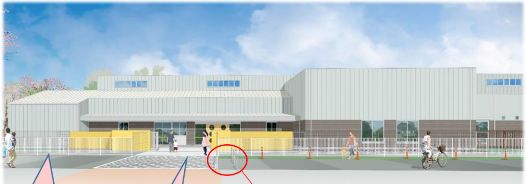
北から南をのぞむ①