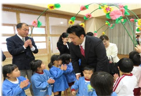
新入園児のお迎え