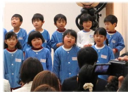
こども園の歌紹介

★掛川市では皆さまからの御意見を基に、地域の理解を得ながら認定こども園化を推進していきます。