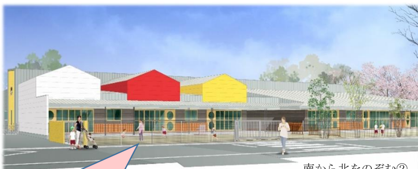
南から北をのぞむ②