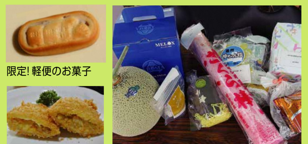
限定! 軽便のお菓子