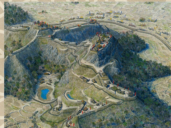
天正6~8年(1578~80)頃の高天神城(作画:考証 香川元太郎)

高天神城をめぐる徳川家康と武田信玄・勝頼父子の間で繰り広げられた激しい戦いは、戦国時代を代表する攻城戦として有名です。「高天神城を制する者は、遠州を制する」と言われ、遠江・静岡(西部)の命運を握る存在でした。横堀・堀切・土塁等の土の城の遺構が落城から四〇〇年以上を経過した現在でも明瞭に残されています。