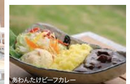
あわんたけビーフカレー