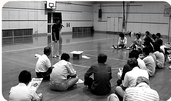
平成22年10月1日 東山口小学校体育館

男女共同参画をより身近に感じてもらうために、推進委員による出前講座を実施しています。資料や紙芝居を使ってわかりやすくお話をさせていただきます。自治会等の集まりがある時はぜひお声をかけてください。