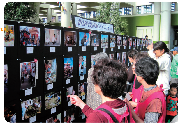
平成22年11月13日・14日/フラワーフェスティバル会場 平成22年11月23日/農業祭会場