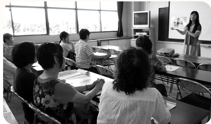
平成22年9月11日 千浜農村環境改善センター