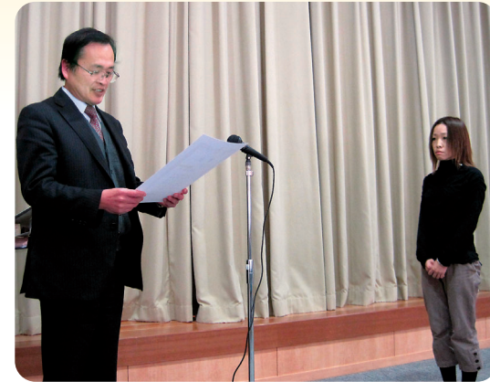
平成23年1月29日/男女共同参画フォーラム表彰式