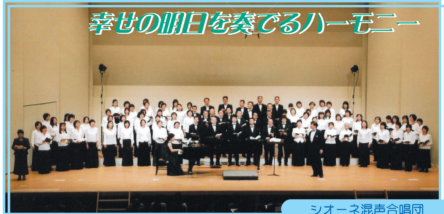
シオーネ混声合唱団

「シオーネ混声合唱団」は、文化会館シオーネの3年越しの講座から生まれました。4年目に入った今年から自主活動として独立し、シオーネを活動拠点として毎週土曜日の夜、練習に励んでいます。