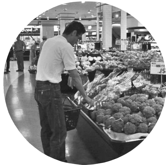
多くなった男性の買い物姿 料理をする男性も増えている

職業は男女差ではなく適性で選ぶ時代が変わりつつあります。仕事と家事（育児・介護）のバランスも国の政策の中で見直され始めています。ところで、掛川市の「男女共同参画」はどうなっているのでしょうか？ 制度や慣習など変わりにくい面もありますが、目に見える変化を写してみました。