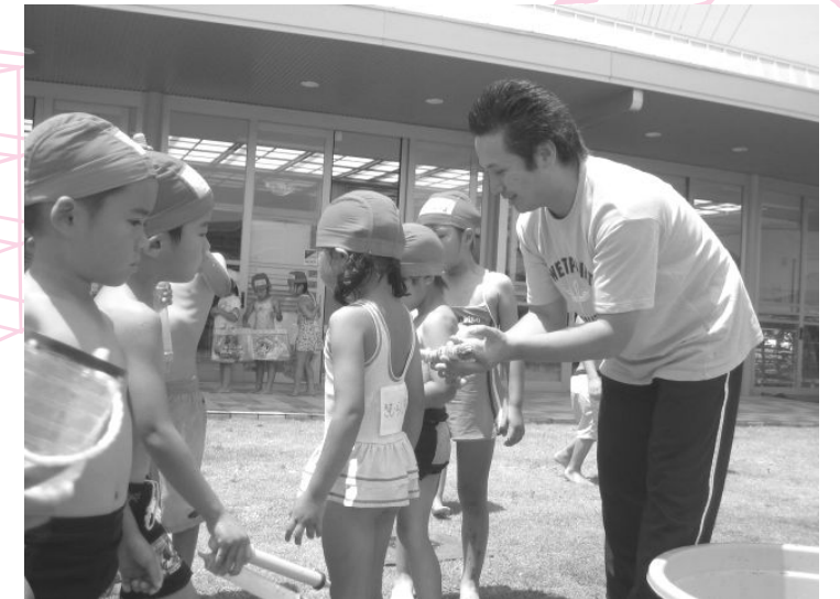
10年前に取材した“男性の保育士さん”

「初めは男の人にやってもらうって抵抗があったけれど、じょうずな人ならどっちでもいいわ」 9人いるスタッフのうち3人が男性。お客も2割が男性だそうだ。 市内の他のヘアサロンでも同じ傾向がある。(写真は市内下俣の「hair rights」)