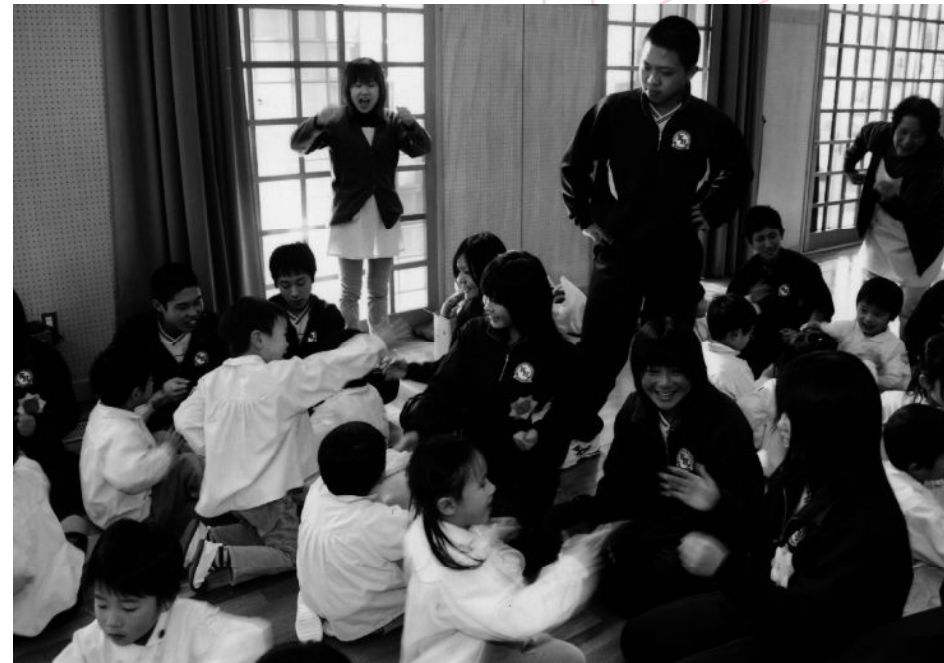
共学になった“掛川東高校”

平成9年度、男女共学校になるにあたり、校歌の歌詞や曲調を変えて男子を迎える準備をしたが、生徒の間では何の抵抗も無くスタート。文化面や体育面での活躍も目覚しく、今夏の高校野球県大会ではベスト8入りを果たした。現在の生徒数は男子342名、女子509名、合計851名。