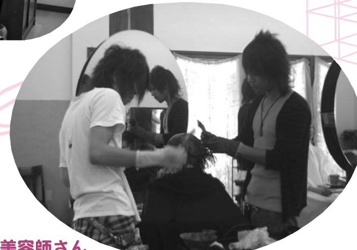
多くなった男性美容師さん

「初めは男の人にやってもらうって抵抗があったけれど、じょうずな人ならどっちでもいいわ」 9人いるスタッフのうち3人が男性。お客も2割が男性だそうだ。 市内の他のヘアサロンでも同じ傾向がある。(写真は市内下俣の「hair rights」)