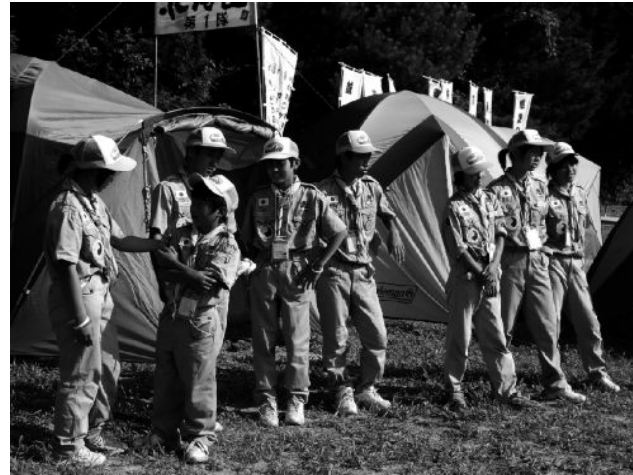
ボーイスカウトへ女兒の入団 男児がガールへはいることはないため、全国的にガールスカウトが衰退している