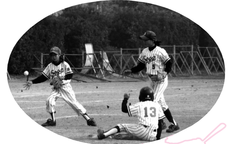
スポーツ少年団 女の子も活発に (曾我小学校)

掛川タクシー(株)に勤続して15年目。「タクシードライバーの勤務は残業もあり大変ですが、色々な人との出会いがあり、毎日が新鮮で感動の毎日です。これからも仕事と家庭を両立させて、人の力になれる人になりたいです」