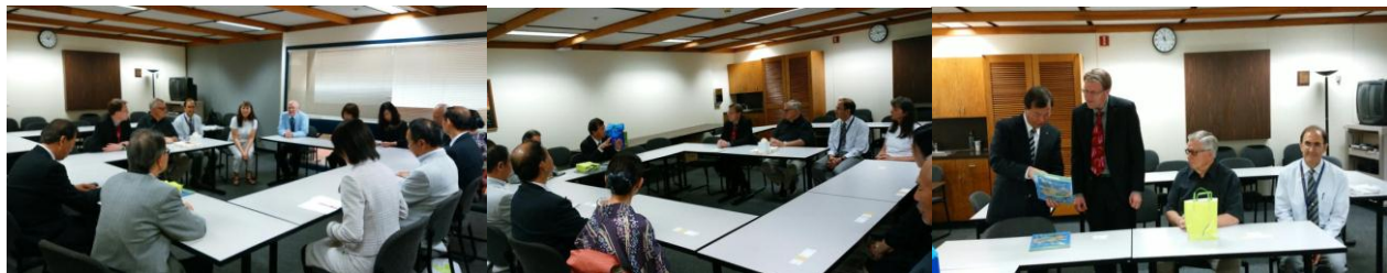
教育委員会との意見交換

内 容：今後の学生の交流について、長期滞在、交換留学制度がとれるかなど、海外体験の機会充実に向けた意見交換を行った。以下、ユージンからの意見等(抜粋) 例年の時期だとユージンは夏休みなので、学区では教育の場が少ない。 オレゴン大学やユージン市に英語教育プログラムについて話をしたらよい。 掛川市同様、国際人の育成に関しては興味を持っている。 提案として①興味を持っている日本の学生を 10～20 人のグループで派遣してはどうか。②掛川とユージンの学校間でスカイプなど、まずはコミュニケーションから始めて、お互いに行ってみたいと思い、訪問する。 夏は難しいので、学校を休んで 2～3 週間来てもらうことになる。日本語教育をやっている先生に受入、ホームステイを頼む。そこでは日本語と英語の両方が学べる。ロータリー、J C、ライオンズなど、ホストファミリーは見つけられる。