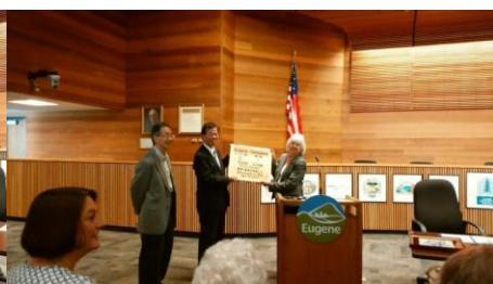
掛川産ヒノキのプレートと市章の額縁贈呈