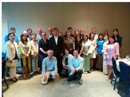
ホストファミリーのみなさんと