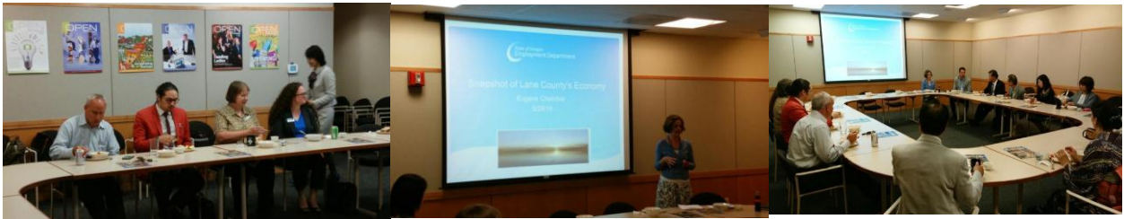
出席者の方に呈茶