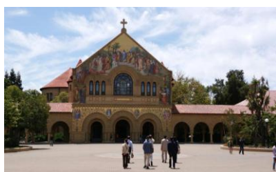
大学内にある教会