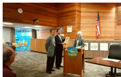
ユージン市からオレゴン産木製置物