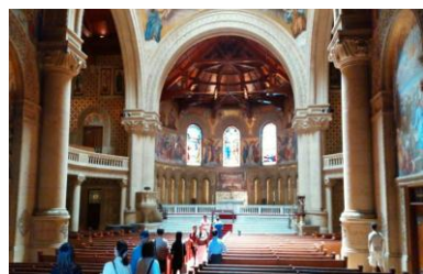
教会内のステンドグラス