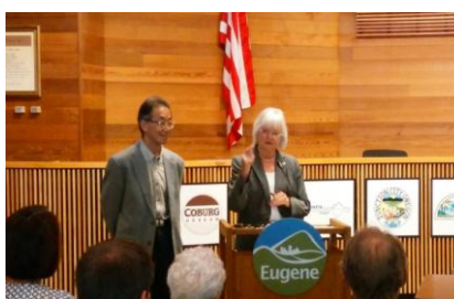
趣旨説明(キティパーシー市長)

内 容：趣旨説明(ユージン市長)、共同宣言書署名、掛川市長挨拶、記念品交換 記念撮影