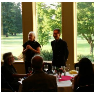
両市長のスピーチ 「様々な違いを理解し、お互い一人の人間としてよい関係を築き、それが世界の平和に繋がっていくでしょう」