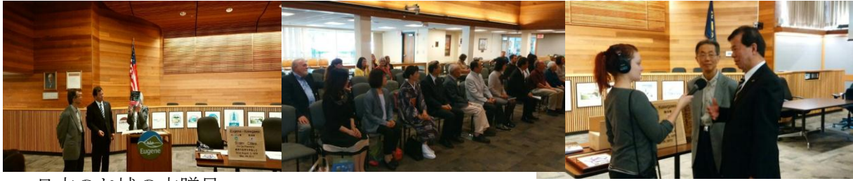
日本のお城の本贈呈