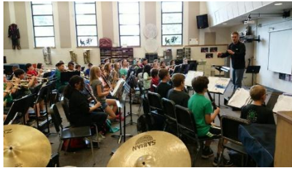
訪問団のために、 楽器演奏や合唱を 披露してくれた