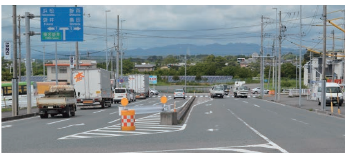
(仮)掛川西環状線と繋がるであろう梅橋交差点

A 掛川市のボール投げの平均は、小学校5年生、中学校2年生共に全国平均より高い。フォーム等投げ方指導の工夫をしている。今後も「ボールを使った運動」の指導の充実を図り、また柔軟性を高める補助運動や腹筋、背筋などを鍛える補強運動により「体力・運動能力」の向上につなげていく。