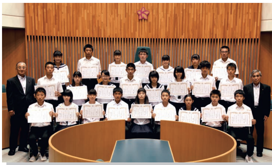
任命証書を受理した24人の子ども議員