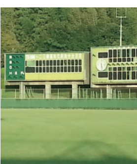
老朽化が進む掛川球場

A 掛川球場は昭和51年の供用開始以来40年が経過しており、老朽化が進んでいる。施設の補修については、指定管理者の掛川市体育協会と相談し、緊急性の高いものから優先して補修を行っており、今後も安全確保を最優先