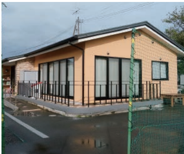
西山口小学学童保育所

A まず土地所有者に土地利用の必要性について御理解をいただく必要があると考える。合わせて、地区まちづくり協議会を中心に、地権者と住民による地区の課題を解決するまちづくり計画を策定し「生涯学習まちづくり土地条例」に基づき、策定したまちづくり計画を、地権者と地元住民及び掛川市で協定し、締結を行うことにより、課題となる土地利用を抑制することと、開発業者による良質な土地利用が推進されるものと考えている。