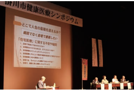
在宅医療推進が語られた掛川市健康医療シンポジウム

掛川市では、在宅医療・介護の支援拠点のふくしあを整備し、訪問看護ステーションの人員確保、資質向上の支援などの機能強化を図ってきた。在宅医療は、6施設の在宅療養支援診療所を