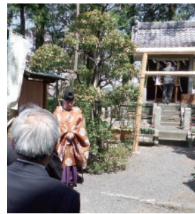
十九首水源地公園 「水道感謝のつどい」

A J R 東海では、河川流量の減少対策として、大井川の右岸側に導水路トンネルを設置し、必要に応じて計画路線の湧水を導水路トンネル取付位置までポンプアップすることにより、河川流量の減少を回避することが可能であると考えている。今後も