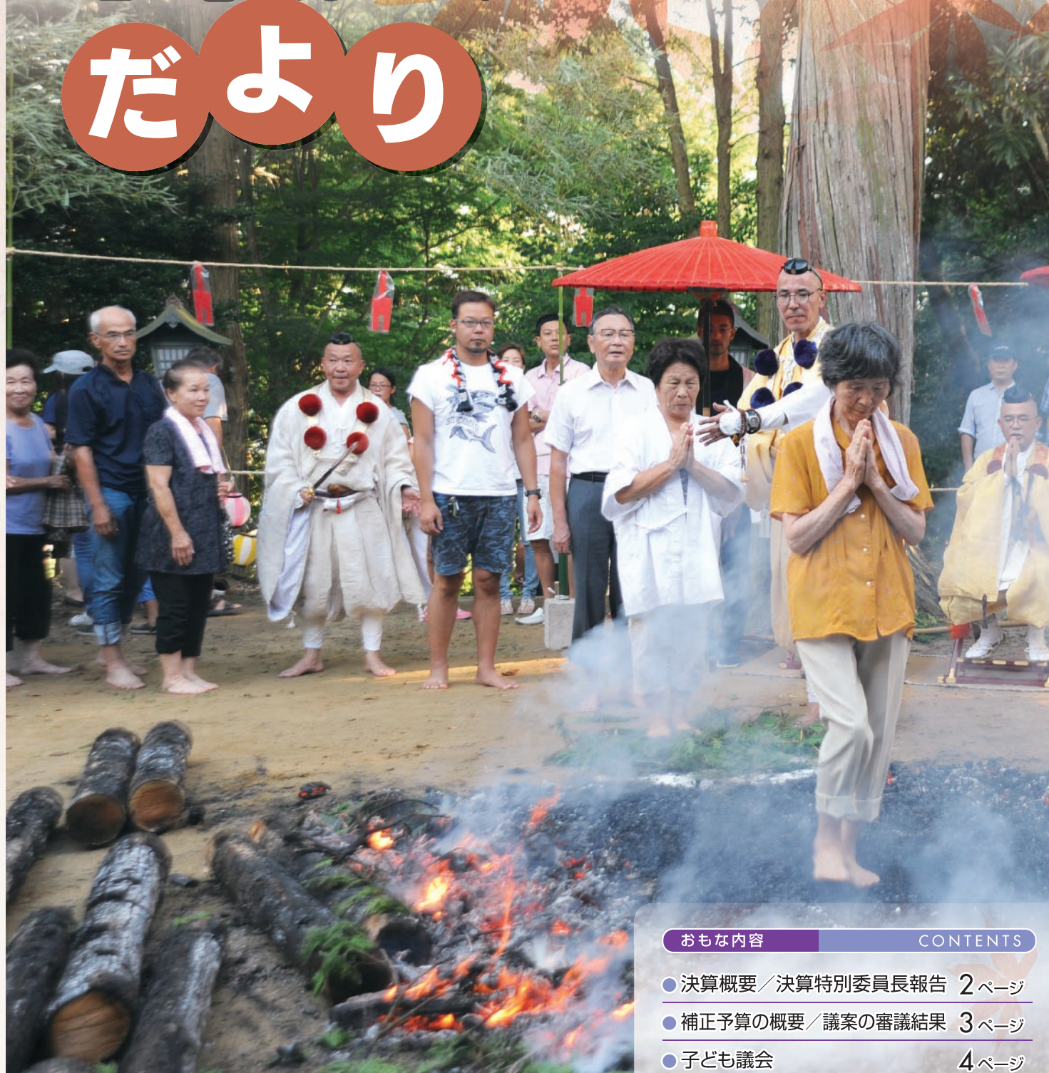
「遠州役行者尊祭典・火渡り行」で開運 (原谷地区まちづくり事業)