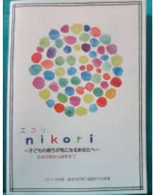
掛川市子育て協働モデル事業で作成されたサポートブック『ニコリ』

A 掛川市では、切れ目のない支援を図るために、乳幼児期の各種健康診断において早期発見に努め、発達の状態によって、こども発達センターめばえの利用や、社会福祉協議会の子育て支援員による訪問につなげている。就学期は、小学校の特別支援学級、特別支援学校等に対応している。窓口の一本化は必要なことと考えるので、今後一本化に向けた検討をする。