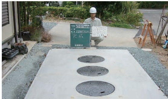
設置された合併浄化槽

により、また、老朽化したコミュニティプラントもあわせて公共下水道に統合し、施設更新費や維持管理費を削減して効率的な運営を目指す。 なお、これらの整備の財源に充てる起債の発行は計画的に行い、将来負担に配慮して事業を実施する。 浄化槽市町村設置推進事業は、平成29年度以降の新規地区の実施はとりやめ、同事業未実施地区での汚水処理については浄化槽個人設置事業を推進する。