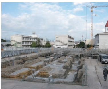
改築中の中央小学校

A 安全面では、工事エリアと校内通路が交差するため、学校内に歩道橋を設け、安全に通学できるよう配慮した。体育の授業は、支障なく実施できているが、子ども達の運動量を確保するため、なわとびやドッジボールを積極的に取り入れるなどの工夫を考えている。小学校陸上競技大会に向けて、NECのグラウンドや西中学校、エコパへ出向いての練習を計画している。