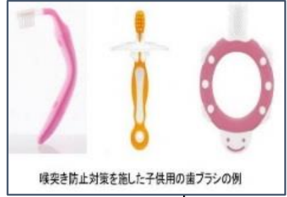
喉突き防止対策を施した子供用の歯ブラシの例