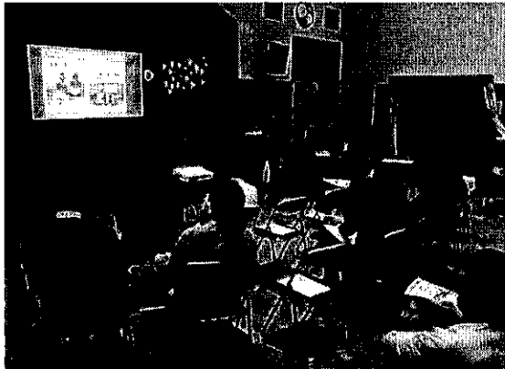
5月1日・2日（子ども広場あんり）

小中一貫教育と新たな学園づくりについて、子ども広場あんりと原谷小・原田小の保護者の皆様へ説明会を開催しました。保護者の皆様からは、小中一貫教育、学校施設の在り方について多くの御意見をいただきました。いただいた御意見は、地域検討委員会に報告をし、今後、学校施設の在り方を検討していく上で参考とさせていただきます。御参加いただきました皆様、ありがとうございました。