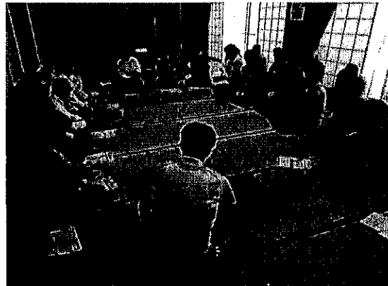
5月19日（原谷小・原田小）