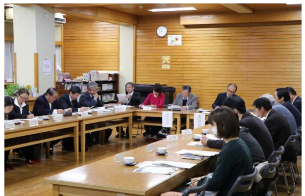
検討委員会の様子

委員からは、学園内での児童・生徒数の減少が深刻になりつつあること、原野谷学園で試行的に取り組んでいる小中一貫教育の取組の効果が表れていること、原田地区・原谷地区というくりではなく原野谷地区という大きな視点で考えることが大切であること、中学校の校舎が老朽化してきているが建て替えにあたっては静岡県内のモデルになるような学校づくりをしていきたい、等多くの意見が出されました。