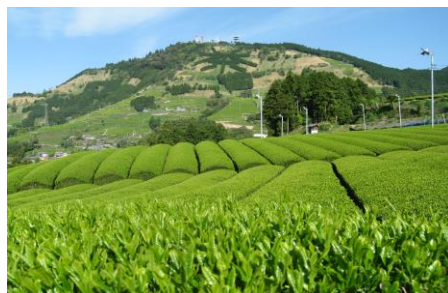
世界農業遺産 茶草場農法