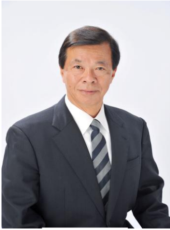
掛川市長 松井三郎

掛川市は、日本列島のほぼ中央に位置し、恵まれた自然と広域交通体系を持つ、ほどよく田舎、ほどよく都会のバランスがとれたまちです。