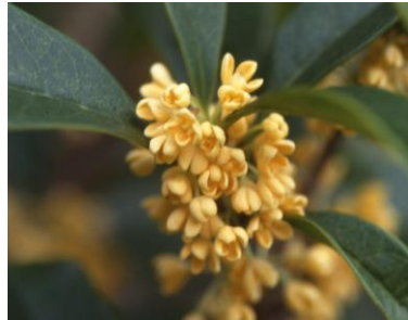
市の木 きんもくせい