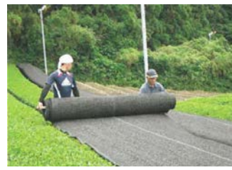
茶の被覆作業の実施