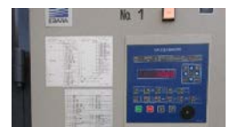
環境制御盤の導入