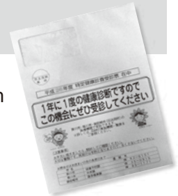
Envelope com o formulário de exame

(国民健康保険加入の40~74歳のみなさんへ~特定健診を受けましょう!) Informações: Hoken Zukuri-ka (☎62-6151)