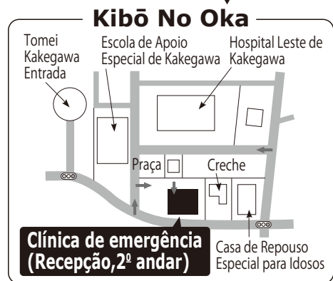
mapa de referência