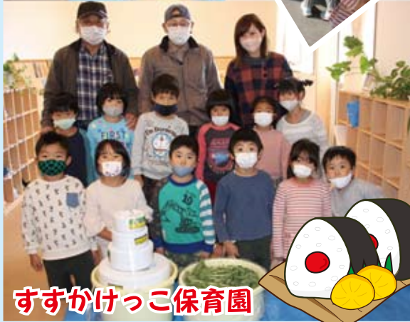
すすかけっこ保育園