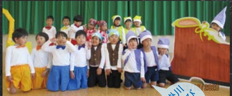
掛川あそび保育園

くるみ幼稚園でも、クリスマスに子供たちの健やかな成長の願いが込められた可愛い手作りのエプロンがボランティアの方々によって作られ、園からプレゼントされました!