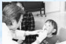
13歳児健康診査の歯科健診