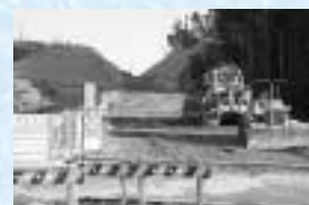
平成20年3月開通予定の掛川高瀬線