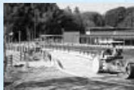
整備が進む22世紀の丘公園▶