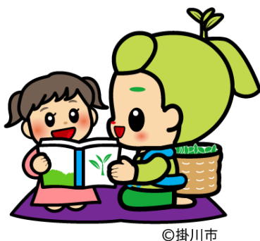
読み聞かせ（のぼりなし）