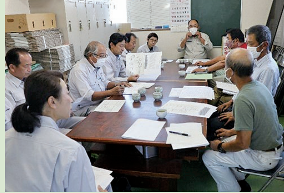
かけがわ西の市での意見交換