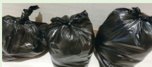
有効な処理が期待される紙おむつごみ

Q ごみの全量外部搬出というピンチを、ごみの分別と減量化を市民が学び実践するチャンスと捉えて施策展開を。