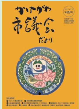
大須賀区域マンホールのふた