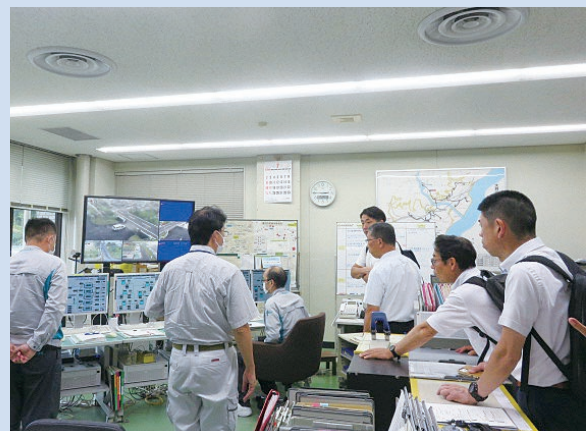
大井川広域水道企業団への現地視察