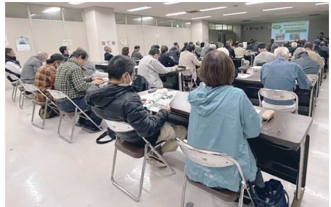
大須賀会場の様子