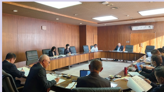
栗東市への行政視察