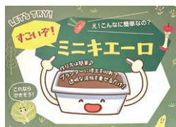
手軽な生ごみ処理器「ミニキエーロ」

Q カーボンニュートラル（温暖化防止）を目的に制定した「もったいないを合言葉にカーボンニュートラルを推進する条例」の推進には、ごみ減量が有効で、全量ごみ外部搬出の処理経費削減につながる。手軽にできるミニキエーロの導入が効果的と考えられているかが。