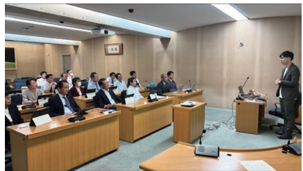
議員研修会の様子