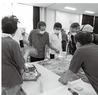
▲令和5年度の訓練の様子