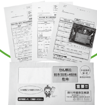
3つの検診を同時に申し込むと一緒に届きます（緑色封筒）