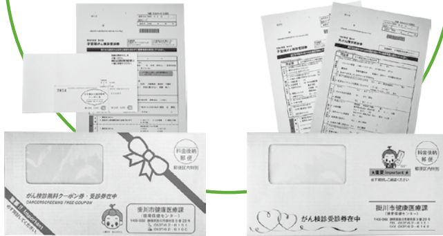
20、40歳の方（ピンク色封筒）

また、20、40歳の方には無料クーポン券に受診券を同封するので、届いたらすぐに医療機関へ予約と受診ができます。