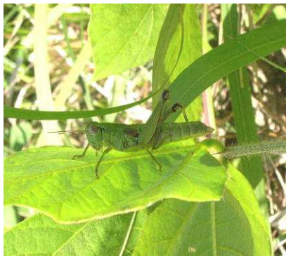
カケガワフキバッタ