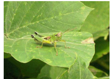
カケガワフキバツタ