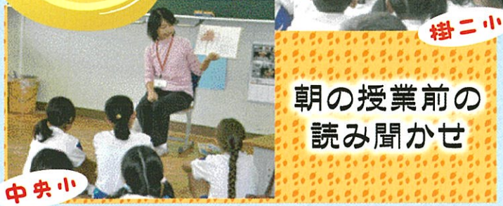
朝の授業前の 読み聞かせ