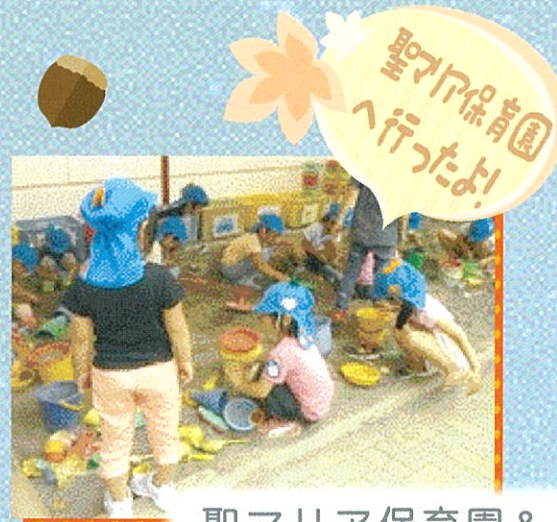
聖マリア保育園 & さやのもり幼保園