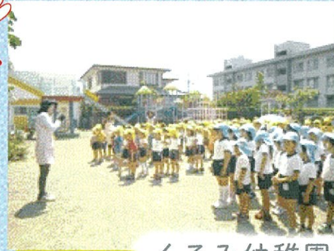
くるみ幼稚園 & さやのもり幼保園