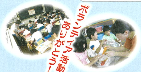
ボリブル活動 あじがら活動