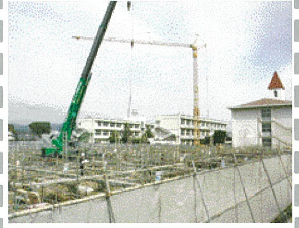
新校舎建設工事まっただ中!

西南郷地域子供教室 西南郷センターでは、6月・7月・9月・10月の平日、8月の三日間に小学校一年生から六年生を対象に地域のかたが主体となって宿題や自由遊び遊びなどの活動をしています。