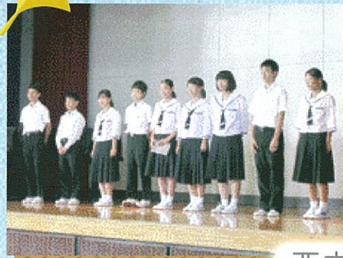
西中 & 掛二小