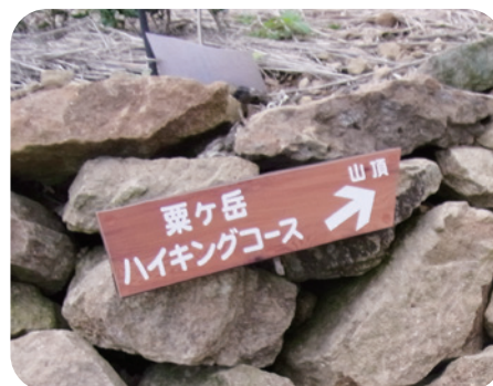
粟ヶ岳公園整備計画に基づき設置された散策道沿道の案内サイン