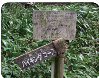
山頂部の案内サイン

市道粟ヶ岳登山道線から南平広場を繋ぐ道路の整備方針を検討し、市と地元住民と協働で進めます。