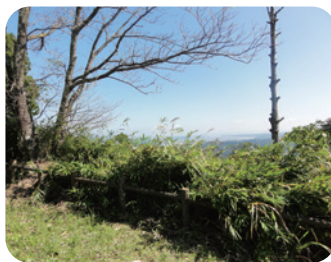
眺望を妨げる草木（南平）