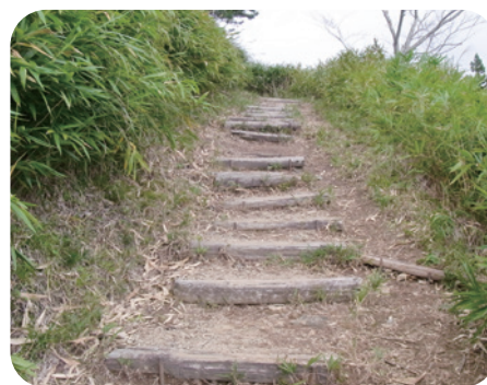
老朽化した散策道