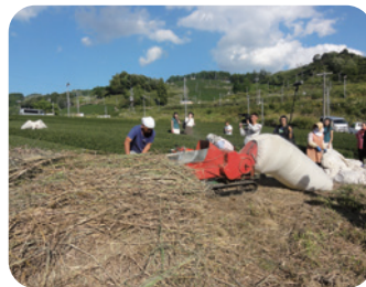
干した茶草を細断する様子

ニホンジカやイノシシなどによる獣害被害の低減のために、猟友会に駆除の委託を継続していきます。