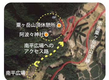
南平アクセス路 (位置図)