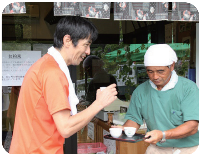
東山茶呈茶サービスの様子

粟ヶ岳に訪れる目的や交通手段の実態、あるいは求める改善点や交流プログラム等のニーズについて把握するアンケート調査を実施します。