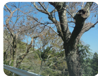
桜の老木（粟ヶ岳南側斜面）