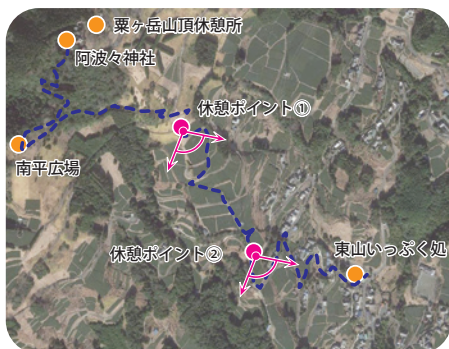
休憩ポイントの整備の考え方1