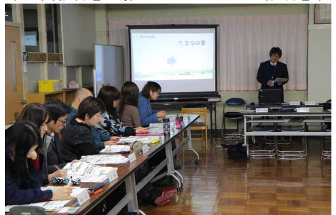
検討委員会の様子

委員からは、「子どもの社会性を単学級の中でどのように育むのが課題となっており、それには多くの人との関わりが必要である」「小学生が中学生になった時に他の学校の子と馴染めるような教育をしてくれると親としては心強い」「学校の校舎が老朽化してきており、建て替えを検討する時期になっているのではないか」「小学校と中学校を1つの敷地に集めない分離型の場合の一貫教育はどのように行うのか」等多くの意見質問が出されました。