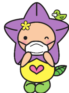
掛川市社協キャラクター 「キョーちゃん」