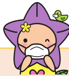
掛川市社協キャラクター 「キョーちゃん」