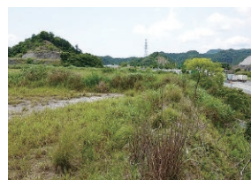
20年近く塩漬けの倉真第二PA用地

Q 上西郷地区の事業用地と新東名倉真第2PAの具体的な活用計画と、この2物件に付加価値を生むことが期待される倉真スマートインターチェンジの実現に向けた所見を伺う。