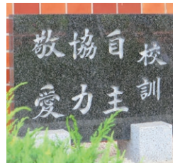
栄川中学校の校訓

Q 選択制制服採用3年目の藤枝市青島中学校では、生徒の主体性が育まれ自分らしく行動する姿が見られ高い評価がある。本市生徒の多様な機能性に配慮した選択制制服の採用について伺う。