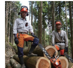
適切な安全装備で安全作業を推進します