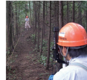
森林の境界を明確にして施業集約化を推進し誤伐を防ぎます