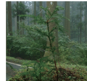
幼木を助け、将来の森林資源を育てます