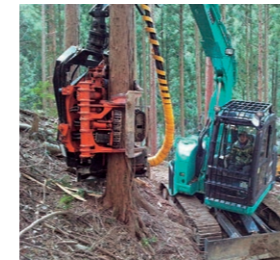
機械の導入と無駄を省いた工程管理で生産コストの削減に努めます