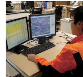
コンピューターを使い流域森林の長期計画を管理します