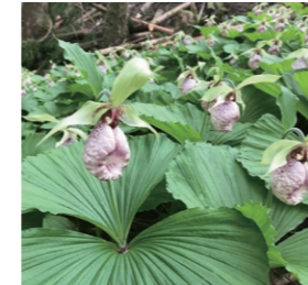
森林に生きる多様な生物に配慮します(写真はクマガイソウ)