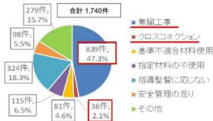
図1 違反行為の内訳※複数回答分を含む