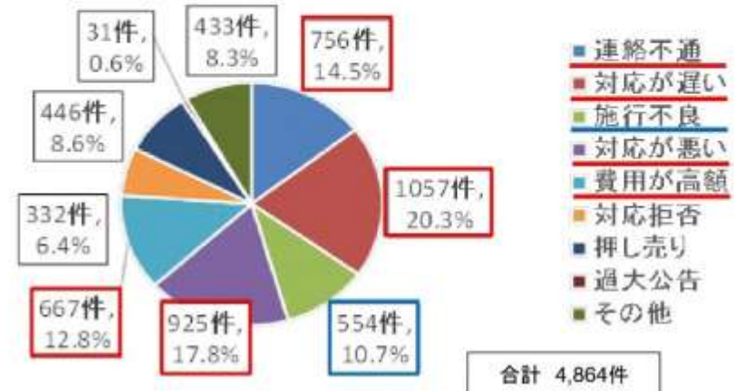
図2 苦情の内訳※複数回答分を含む