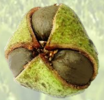
デザインコンセプト

お茶の実には3つの種が入っています。未来を生きる子どもに付けたい3つの創る力をお茶の実の3つの種に見立てました。いつの日か、世界に誇る掛川茶のようにグローバルに活躍する人に育ってほしいという願いを込めています。