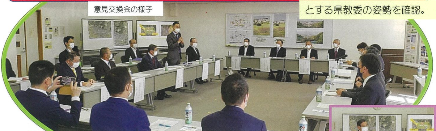
とする県教委の姿勢を確認。

今後とも、大須賀区民皆様のご支援ご協力をいただきながら、是非この地に横須賀高校を末永く存続させましょう!!