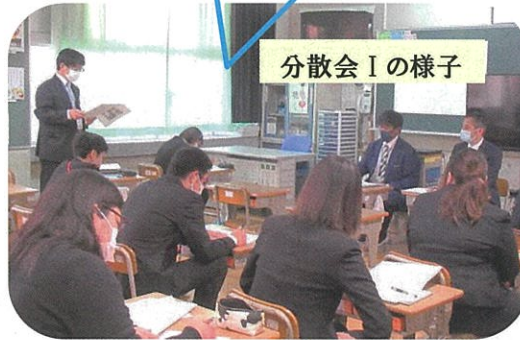
分散会 I の様子

今後の若つじ学園連携のあり方について、設定したテーマに沿って、それぞれ専門担当別に分散して話し合いをされました。大須賀の園児、児童、中学生のそれぞれの特徴を共有することは一貫教育にとってとても大切なことだと思います。