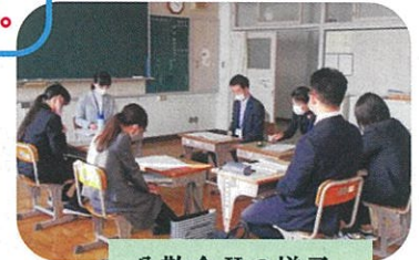
分散会 II の様子