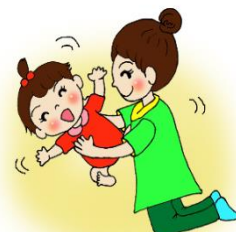
くすぐりっこ(0歳児)

山口教授と協働実施したコホート研究の結果や具体的なスキンシップの方法をかわいらしいイラストで紹介したリーフレット(3種類)を作成しましたので、ぜひご覧ください。