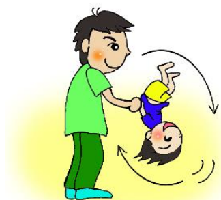
ぐるりんこ(1歳児～2歳児)