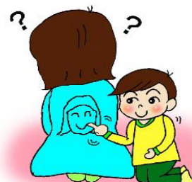
背中に描いてな～んだ (幼児)