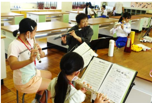
令和3年10月16日 掛川文化クラブ活動 掛川市立中学校の音楽室や多目的室、被服室などを利用して活動

掛川文化クラブは、市内中学校の校舎内で活動しています。学校部活動と同様に地域クラブが学校施設を活用できることで、各家庭の費用負担を大きく軽減できます。また、楽器のように、必要な備品の保管もできるため、生徒の活動場所までの移動が容易になります。