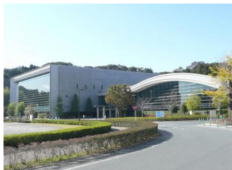
東遠カルチャーパーク総合体育館「さんりーな」