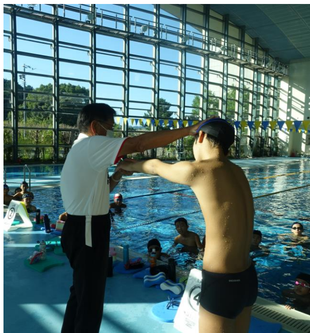
令和3年10月掛川水泳クラブ練習会 東遠カルチャーパーク総合体育館さんりーな

10～1月の休日の部活動従事時間100%減（約25時間） 10～1月の平日の部活動従事時間38%減（約10時間） ※前年度比