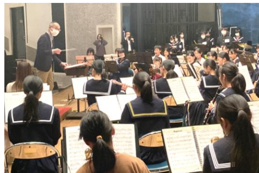
令和3年11月27日 吹奏楽交流会 市内吹奏楽部員や地域の楽団員、高校生や大学生が一堂に会して大会奏

また、大会運営についても、地域団体が主体となって運営できる体制の整備が必要です。