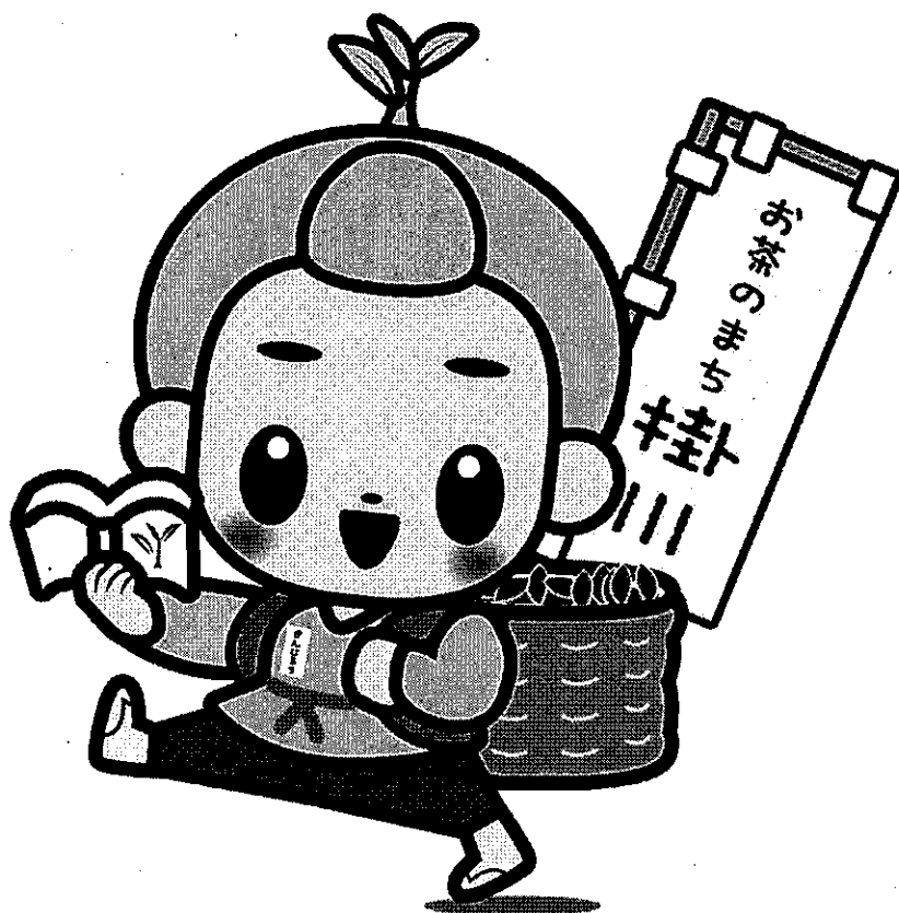
「茶のみやきんじろうくん」・掛川市