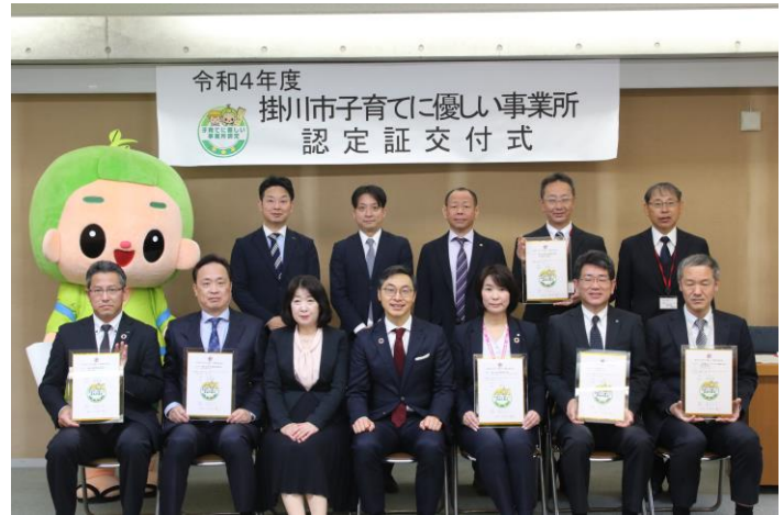
令和4年度認定証交付式