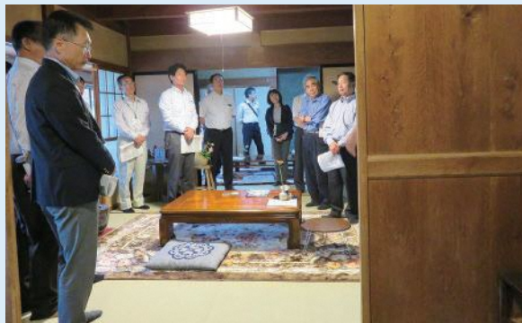
掛川初の体験型古民家宿 旅ノ舎