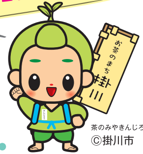
茶のみやきんじろう