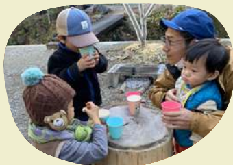
焚き火で おやつタイム！