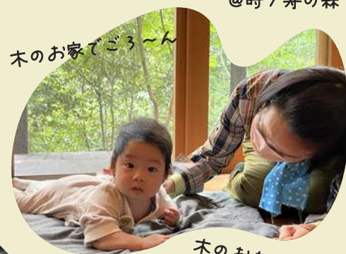
木のお家でござ〜ん