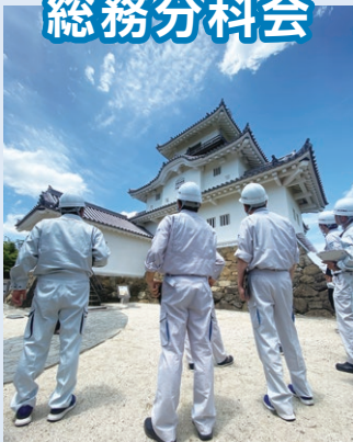
掛川城の改修工事