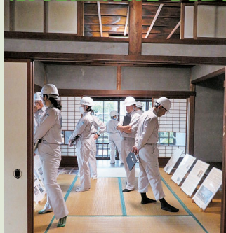
松ヶ岡（旧山崎家住宅）の保存活用工事