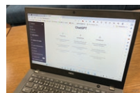
対話型人工知能(AI)「チャットGPT」

Q 業務の効率化のため、行政文書 や市民へのお知らせなど庁内 の文書案の作成に、対話型人工知能(AI)「チャットGPT」 を活用することは、 DX推進の一方の方 法と考えるが、見解 を伺う。