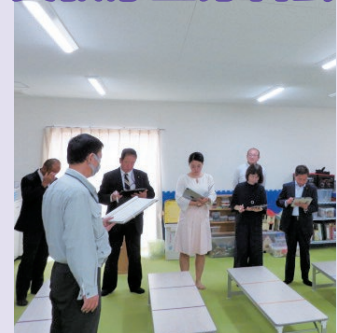
令和5年4月に開所した西山口小学児童保育所南館