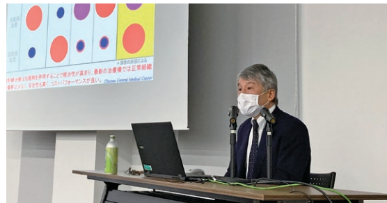
中東遠総合医療センターにて