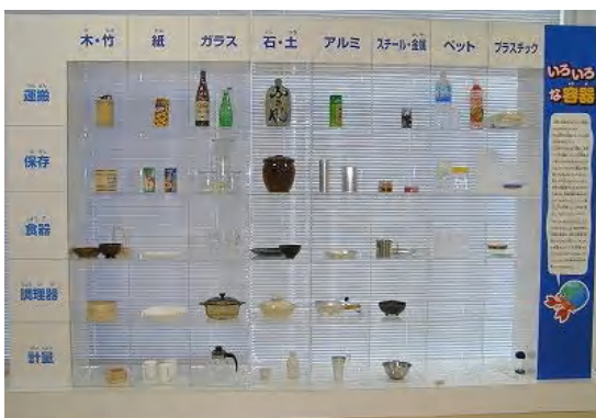
用途別に並ぶ様々な容器