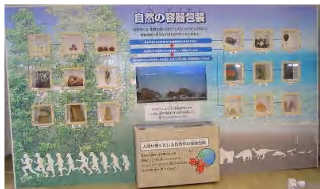
ひょうたんなど自然界にある容器