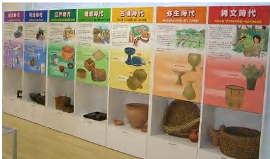
縄文時代から現在までの容器の移り変わりがわかります