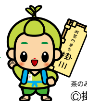
茶のみやきんじろう

ぼくの名前は「茶のみやきんじろう」。お茶のまち掛川のキャラクターだよ。ぼくといっしょに、掛川市のことについて、たくさん学習していこう。